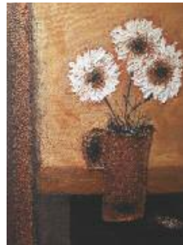
Rita Arendt «Kupferblumen» Acryl / Jute