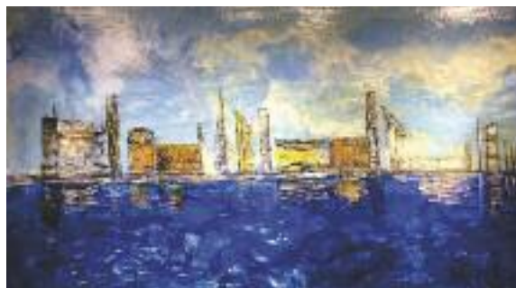
Helen Staubli «Am Hafen» Enkaustik (Wachsmalerei)