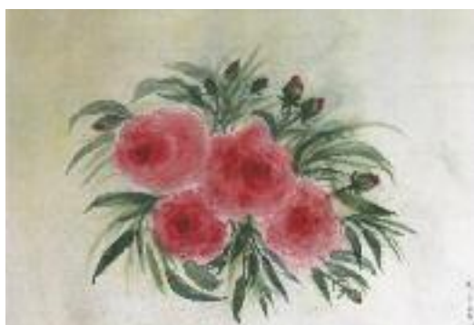
Ann-Elisabeth Lauber «Blütenpoesie» Aquarell

Lassen Sie sich überraschen was Chamer Kunstschaffende kreieren