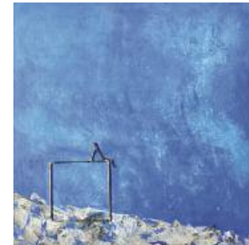
Lisbeth Knüsel «Freiheit» Acryl / Metall