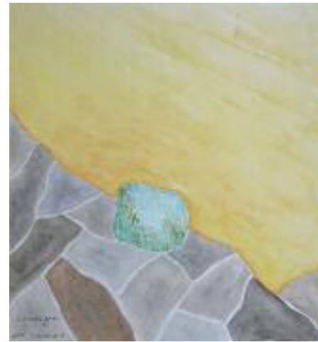
Irene Bruhin «Findling» Aquarell