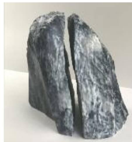
D.P. Künstler der Kunstwerkstatt an der Lorze «Twins» Speckstein

Wir danken allen, die diese Ausstellung möglich gemacht haben: