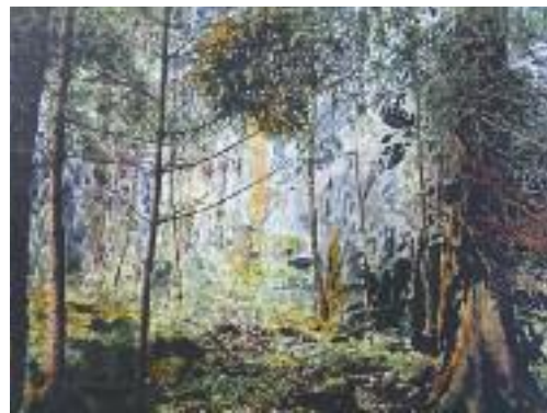
Cäcilia Ott «Ebnetwald», Ausschnitt Foto, Offsetdruck, bearbeitet mit Tusche, Schellack, Glasfarbe