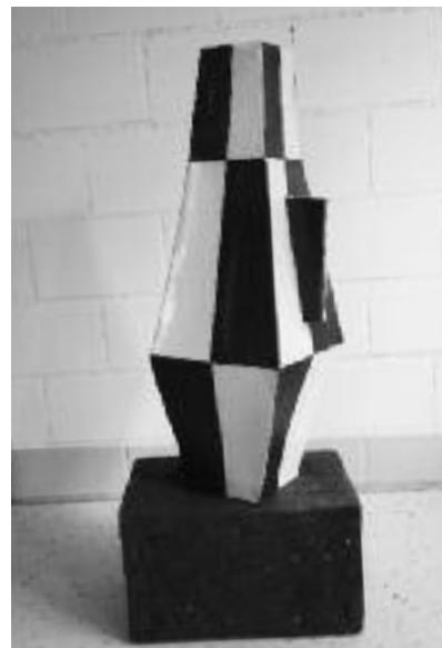
Liselotte Briner «Bodenkrug» Steinzeug