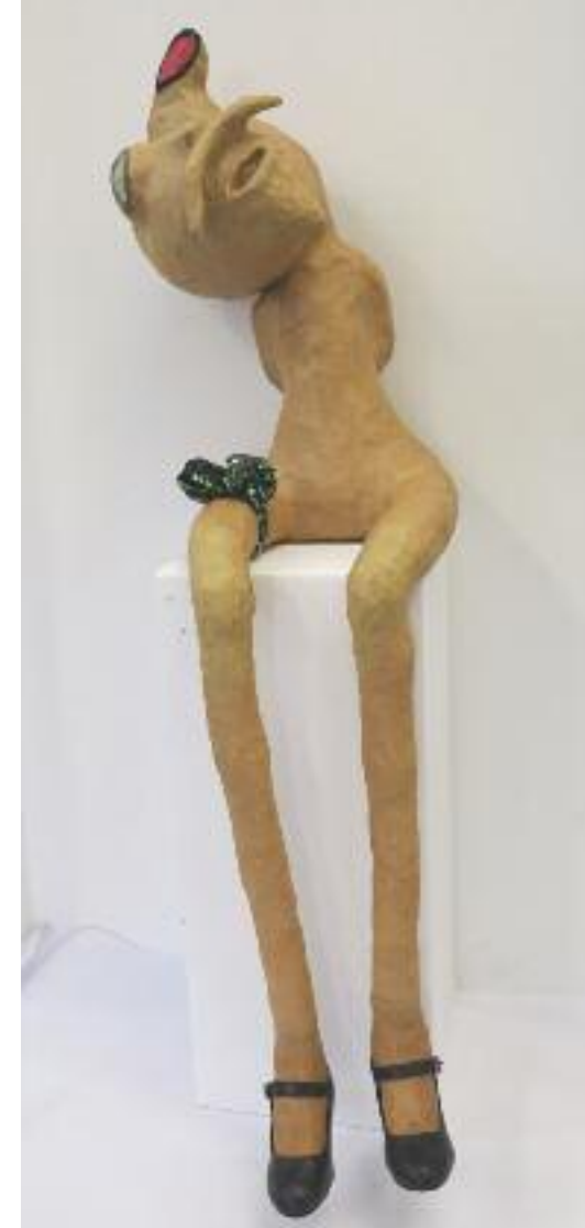
Bild oben: Mel Sommerhalder Künstlerin der Kunstwerkstatt an der Lorze «Wer ich bin» Papiermaché