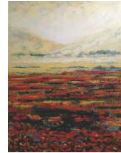
Carla Rogger «Mondlandschaft» Acryl