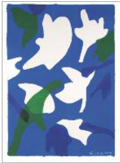
Reto Seufert «Farbige Formen» Acryl auf Papier Schablonendruck