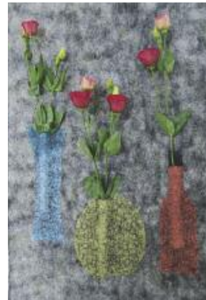
Ursula Nussbaumer ohne Titel Filz mit Seide