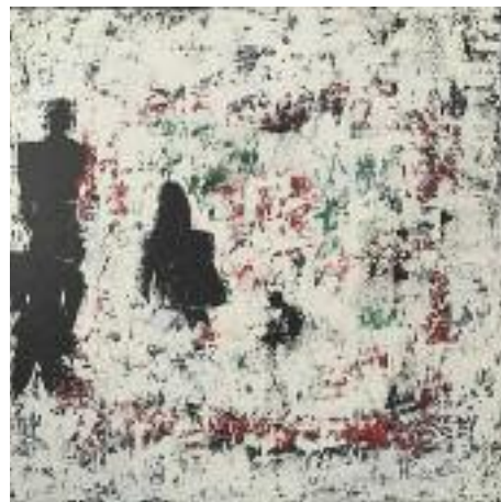
Irene Renner «zielstrebigezeiten» Acryl auf Leinwand