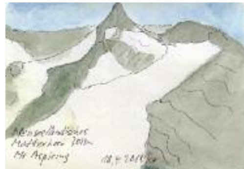
Hans Raimann «Neuseeländisches Matterhorn» Tusche / Aquarell