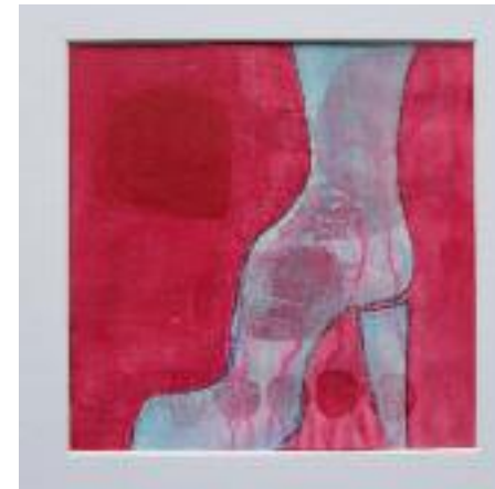
Susanne Albrecht «Stiefel pink» Acryl / Mischtechnik