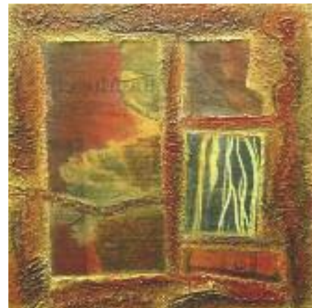
Verena Winiger ohne Titel Collage / Eitempera